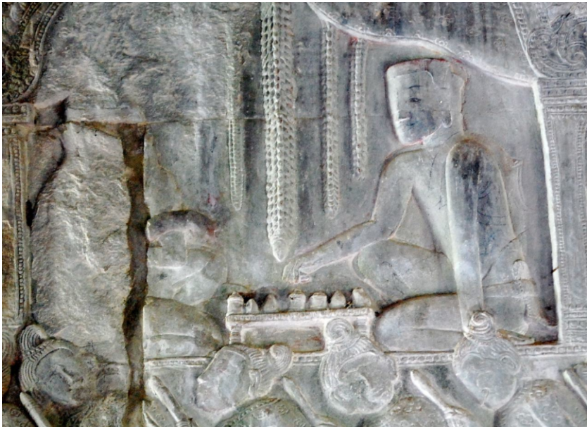
Изображение играющего человека в тайландском храме

Цель игры — срубить все фишки противника, сохранив свои.